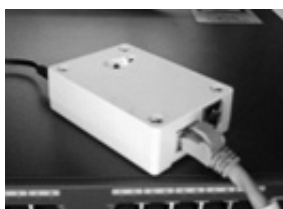
図4 PC 不正接続検知排除システム (アプライアンス)

現在学内のネットワークでは、どの PC でも、IP アドレスとプロキシサーバーの設定をすれば、インターネットへ接続できるようになっている。しかし、誰かが学外から PC を持ち込んでその設定さえすれば、ネットワーク接続ができるため、情報セキュリティ的に問題であった。私物ノート PC などのいわゆる「学外持ち込み PC」が、無許可で学内ネットワークへ接続される“不正接続”を防止するため、PC 不正接続検知排除システムのアプライアンス（特定機能に特化した製品）を導入することにした。この製品の機能として、登録された学内ネットワーク接続機器の MAC アドレス以外は、通信妨害信号が出されてネットワークに接続できなくなる。ところが、いざ“MAC アドレス未登録 PC「排除」モード”で稼働させてみると、何故か正規登録した PC までも不正扱いしてしまうという状態になっていた。詳しい原因はまだ調査中であるが、校内の VLAN の切り方が複雑なため、この製品が動作できていない模様である。当面は「排除」でなく「検知のみ」モードで動作させ、学内ネットワークの状況を見守っている状態である。