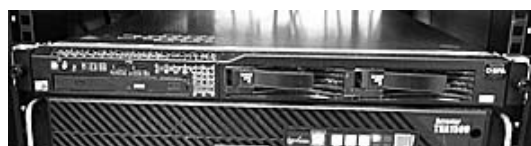
図 3 Web 認証ゲートウェイ（アプライアンス）

しかし、デメリットとして、Windows Update や Google Chrome の更新等、自動アップデート機能があるソフトウェアが更新できない状態が見受けられる。これについては、プロキシサーバー側で対象 URL を認証除外 URL として登録し、自動アップデートすることができるよう調整対応中である。