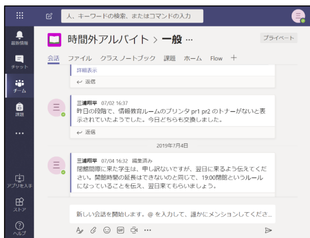
図3 Teamsのチャット画面

学生アルバイトと連絡を取る場合、今まではメールでの連絡が主体であった。しかし、ちょっとした連絡や報告をするにはメールは敷居が高く、実際、今まではほぼシフト交代の連絡しか行われていなかった。そこで、Teamsを導入し、コミュニケーションの活発化を図った。TeamsもFormsと同様にOffice 365のサービスの一つである。チャット形式のTeamsであればメールより敷居が低く、気軽に質問や相談などが行え、また、チーム内での会話や意見を共有しやすくなると考えられた。Teamsを導入してアルバイトメンバーと職員が参加するチームを作り、運用することにした。図3はTeamsにおける時間外アルバイトチームの画面である。